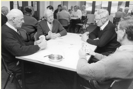
Kaarten op woensdagmiddag