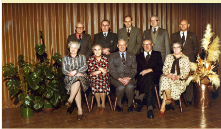
1979: Het bestuur