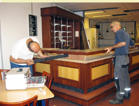
Verbouwing in de bar