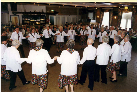
2000: Volksgroep DO-SI-DO