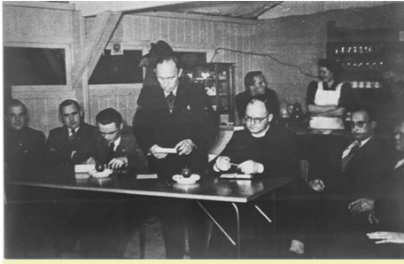
1953: Het begon in de kantine van RAC