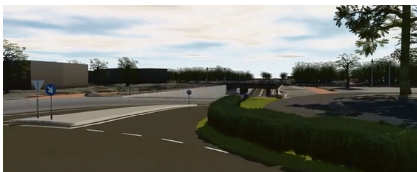
Verbeelding van de tunnel provinciale weg N631 (Vijf Eiken)

Rijen dan goed bereikbaar blijft voor alle verkeer. Of dat zo is moet nog onderzocht worden.