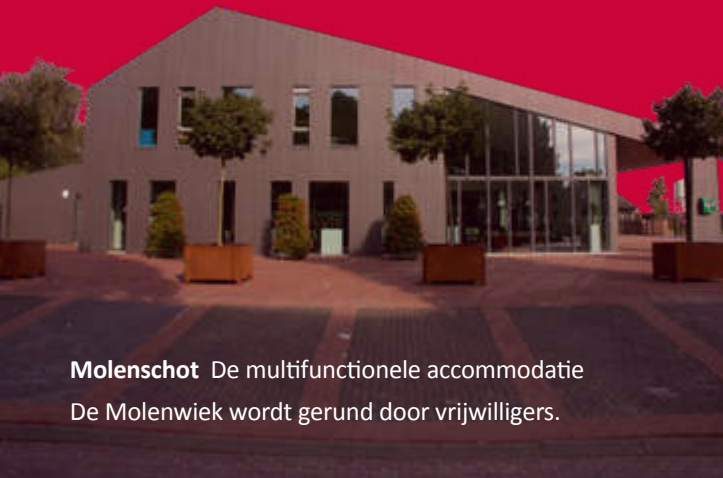
Molenschot De multifunctionele accommodatie De Molenwiek wordt gerund door vrijwilligers.